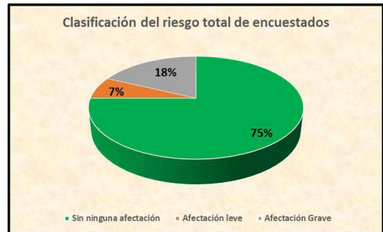
Gráfica 2. Clasificación del riesgo total de encuestados