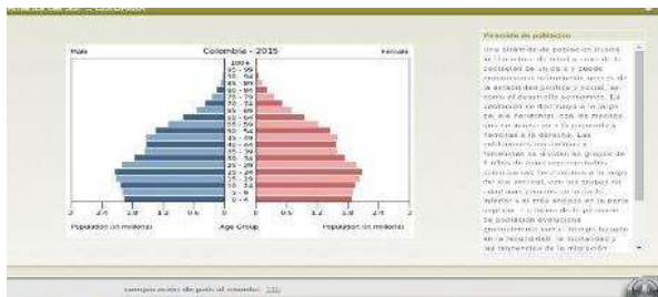
Figura 1. Pirámide de población