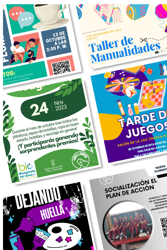
Figura 5. Collage de posters publicitarios de actividades.

Para llevar a cabo el proyecto, se conformó un equipo multidisciplinario de estudiantes de Educación Infantil, docentes universitarios y voluntarios de la comunidad. Se utilizaron materiales didácticos y recursos locales para facilitar las actividades. Además, gracias a las alianzas estratégicas con entidades locales y el compromiso del equipo, se optimizaron recursos y se garantizó la sostenibilidad del proyecto.