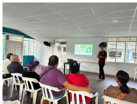
Figura 2. Fotografía de socialización de plan de acción.

Durante la segunda fase, se trabajó con la Junta de Acción Comunal (JAC) para sensibilizar a los líderes comunitarios sobre estrategias ambientales y asegurar su apoyo en el proyecto. De este modo, se organizaron asambleas para involucrar a los habitantes en la toma de decisiones y aumentar la conciencia colectiva sobre el entorno. Se lanzaron campañas de reciclaje, se planificaron talleres con materiales reciclables y se realizaron jornadas de limpieza en espacios públicos, incentivando la participación con refrigerios.